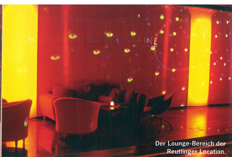
Der Lounge-Bereich der Reutlinger Location.

Line) sind unterschiedlich regel- und somit variierbar; die Ecklautsprecher an der Traverse lassen sich separat von den mittleren regeln, um den Lärmpegel im Außenbereich zu verringern und auf der Tanzfläche selbst zu verstärken. Wegen der hohen Effizienz und Zuverlässigkeit im Dauerbetrieb wurden die Endstufen der Marke Camco ausgewählt. Für den DJ stehen u.a. Technics-Plattenspieler sowie Pioneer Doppel-CD-Player zur Verfügung.